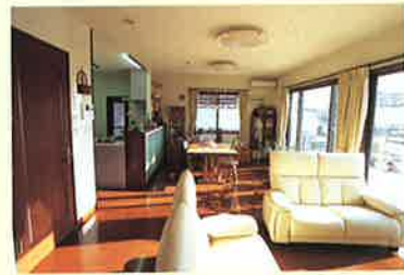
日差しが差し込む明るいLDK。