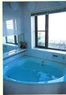
ワイドな浴室。眺望も楽しめます。