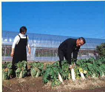
畑仕事に精を出されているご夫妻。

農繁期には毎日田んぼや畑に出て行かれるご主人。毎日の食卓には収穫された旬の野菜がのどか。自然に囲まれたたくらしを満喫されています。